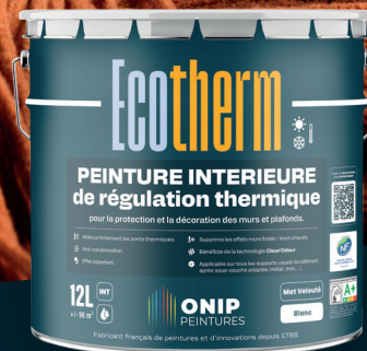
Peinture intérieure de régulation thermique