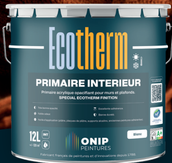
Primaire intérieur opacifiant

AMÉLIORE LE CONFORT THERMIQUE DE VOTRE HABITAT ÉTÉ COMME HIVER.