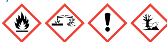
GHS02 GHS05 GHS07 GHS09